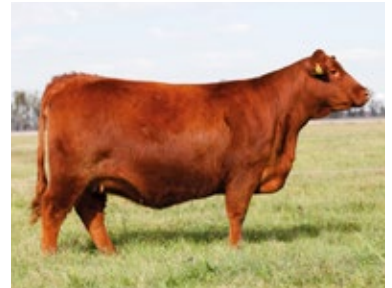
VQ LOTE 11: RP 3475