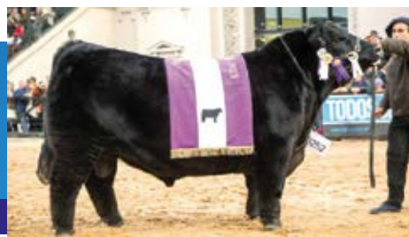
EURO, Su padre.

Muy buena y atractiva hija del padre más importante Angus negro de los últimos años y que al final de su campaña sin dudas será un referente de la raza. Gran familia materna con bases en Terragarba y Huaca Curú, con preñez de Mr Angus y destacados números que dan solidez a este lote.