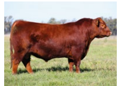
TORO LOTE 8: RP 3648