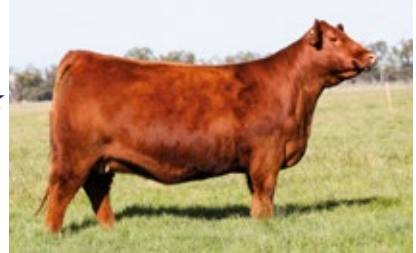
GUSTI 3585 T/E CONCURRE A PALERMO 2018

VARIOS ANIMALES PREMIADOS EN EXPOSICIONES ANGUS