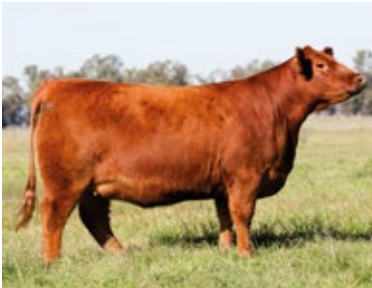
VQ LOTE 8: RP 3587