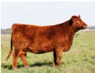
TERNERA LOTE 3: RP 3673