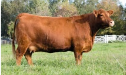
GUSTI 2967 T/E DONANTE ACTUAL EN LA ANGELITA