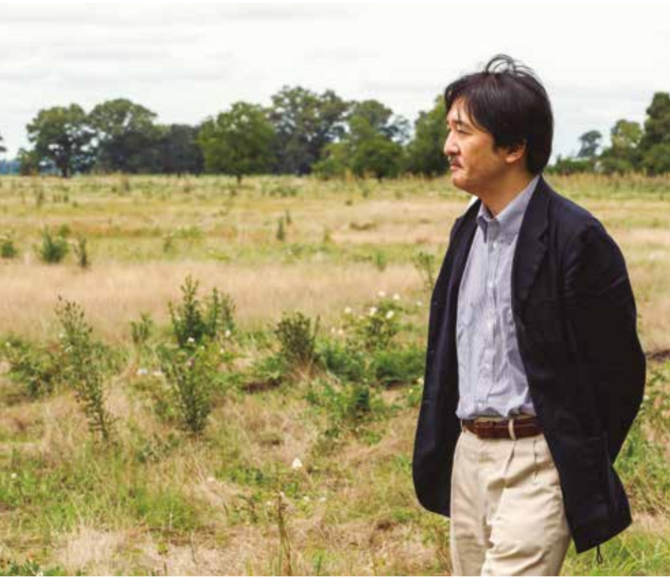
Foto El príncipe Akishino durante la recorrida por el establecimiento La Pastoriza.