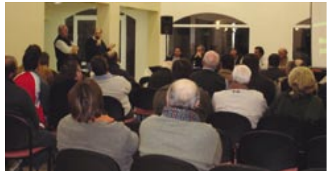
Vista del salón auditorio del Hotel La Campiña, cercano a Santa Rosa, donde se llevó a cabo la reunión abierta de directores de la Asociación con socios AnGus de La Pampa.

5) Los animales que no cumplan con esta exigencia serán rechazados por el jurado de admisión y no podrán participar del juzgamiento; en caso de dejar lotes incompletos, estos quedaran sujetos a las respectivas reglamentaciones que limitan su participación.