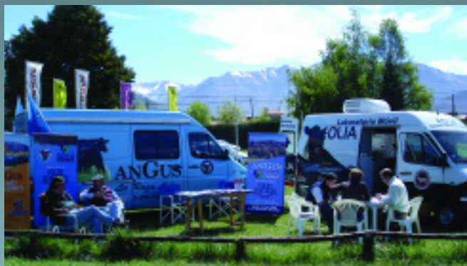
Vista de los móviles de AnGus y Eolia S.A. en la Exposición de Esquel.