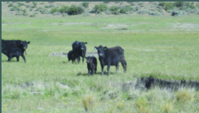
Vacas MaS Patagónicas en la estancia "Camaruco" (Esquel).