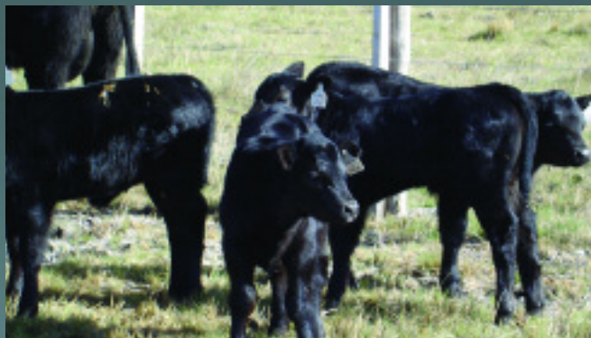
Grupo de terneros de Pedigree en la estancia "Camaruco" (Esquel), provenientes del convenio Angus-Ministerio de la Producción de Chubut.