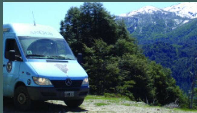
El Móvil 01 de la Asociación anduvo recorriendo rutas en la precordillera patagónica, escenarios que le son poco familiares.