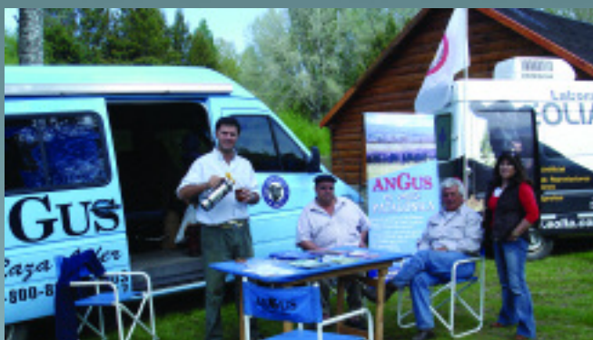
Al igual que en la Sociedad Rural de Esquel, los móviles de Eolia y de AnGus fueron permanentemente visitados por ganaderos de la zona.