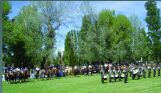
Acto inaugural de la misma fiesta en el centro de la amplia pista de juzgamiento y actividades diversas en el pintoresco predio de Junín de los Andes.