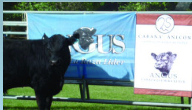
Las cabañas de AnGus de la Patagonia han comenzado a realizar fuertes acciones de marketing en los eventos ganaderos de la zona.