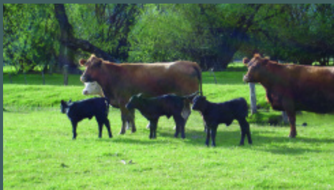
Primeros terneros nacidos por el convenio "Polos Genéticos" en la provincia de Chubut. Estancia "Huechimapu" (Trevelin).