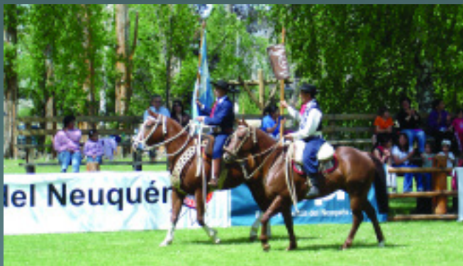
Una imagen de las celebraciones correspondientes al Día de la Tradición organizadas por la Sociedad Rural del Neuquén.